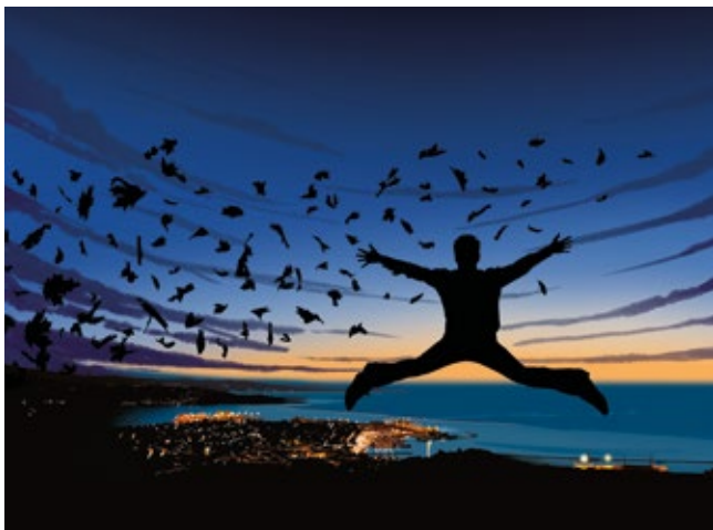
Città nel vento, 2018 Pittura digitale, stampa su carta fine art 48,2 x 32,8 cm