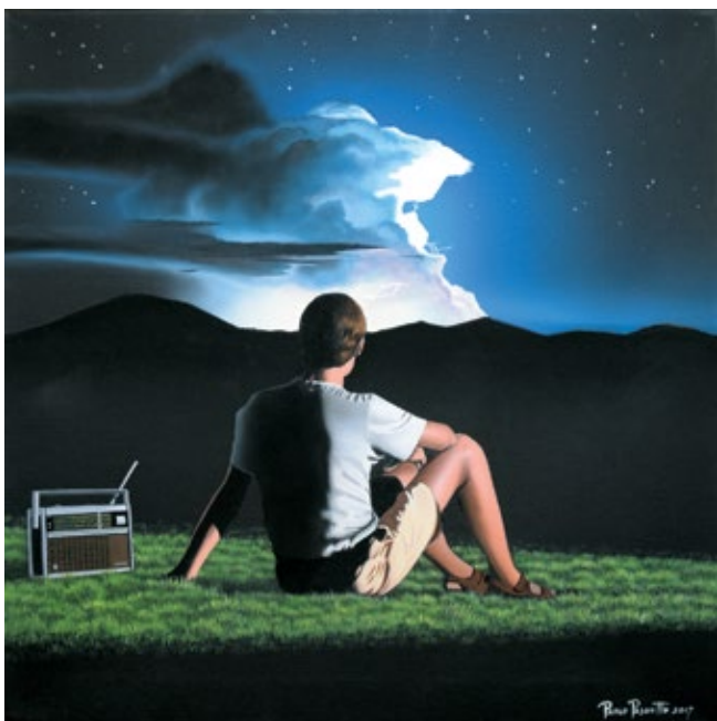
Tra il Carso e le stelle, 2017 Acrilico su tela, 40x40 cm

PAOLO PASCUTTO è nato nel 1967 ad Aurisina, sul Carso triestino. Dopo gli studi all'Istituto Statale d'Arte e all'Università di Trieste si è dedicato all'illustrazione e alla grafica pubblicitaria, coltivando contemporaneamente la sua passione per la pittura.